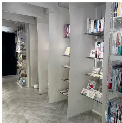
大判の和紙でできた仕切り